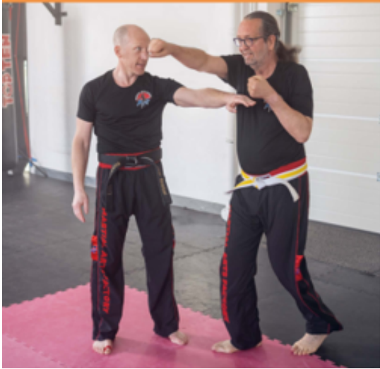
Kickboxen gegen Parkinson

Werden Sie aktiv und bleiben Sie es! Wir setzen uns für eine nachhaltige Verbesserung der Lebensqualität von Menschen mit Parkinson ein.