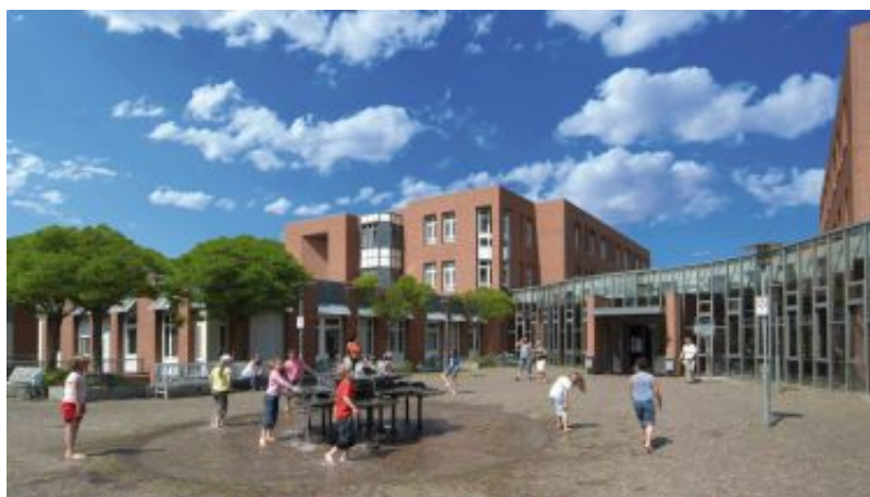
Psychiatriisches Zentrum Nordbaden