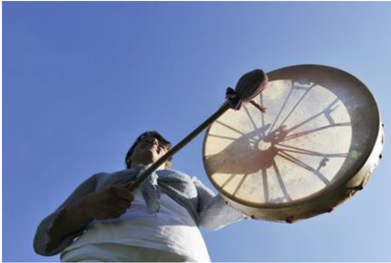
Rahmentrommel als Begleitinstrument