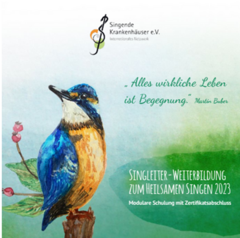
Titelbild des Terminflyers

Wir präsentieren stolz unsere neuen Weiterbildungsbroschüren für die Singleiter-Weiterbildung Pflegeeinrichtungen und Senioren sowie für Krankenhäuser und Gesundheitseinrichtungen . Diesmal gibt es sie auch wieder gedruckt - in kleiner Auflage. Außerdem finden sich alle Termine auf einen Blick in unserem handlichen Flyer , den diesmal ein Eisvogel ziert und somit akustisch und visuell Signale setzt. Link zu Weiterbildung/Info .