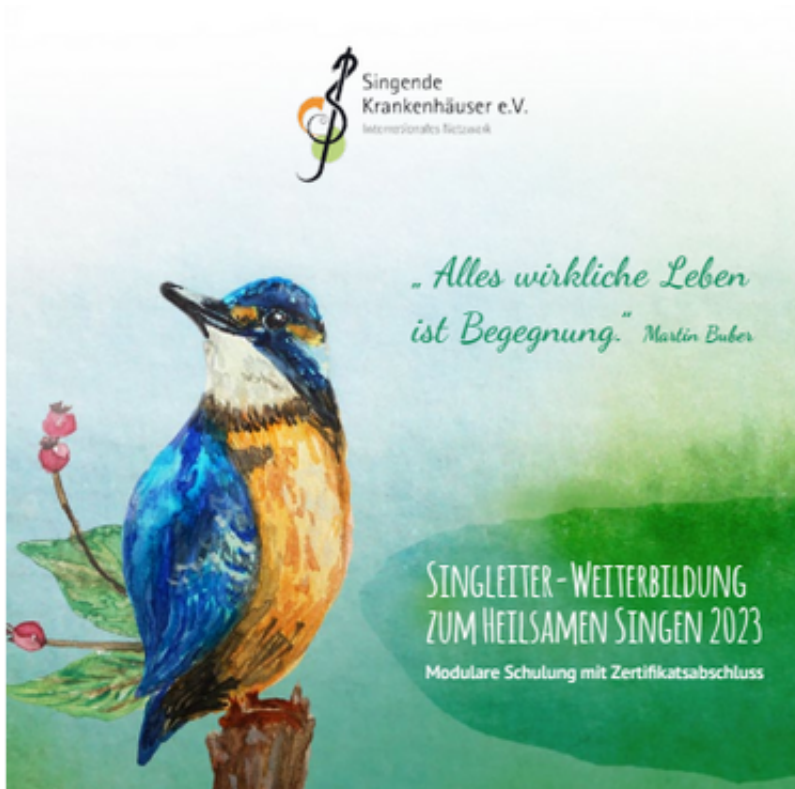
Titelbild des Terminflyers

Wir präsentieren stolz unsere neuen Weiterbildungsbroschüren für die Singleiter-Weiterbildung Pflegeeinrichtungen und Senioren sowie für Krankenhäuser und Gesundheitseinrichtungen . Diesmal gibt es sie auch wieder gedruckt - in kleiner Auflage. Außerdem finden sich alle Termine auf einen Blick in unserem handlichen Flyer , den diesmal ein Eisvogel ziert und somit akustisch und visuell Signale setzt. Link zu Weiterbildung/Info .